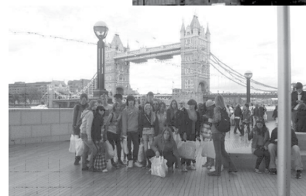
Dvojezičnost u nastavnom procesu